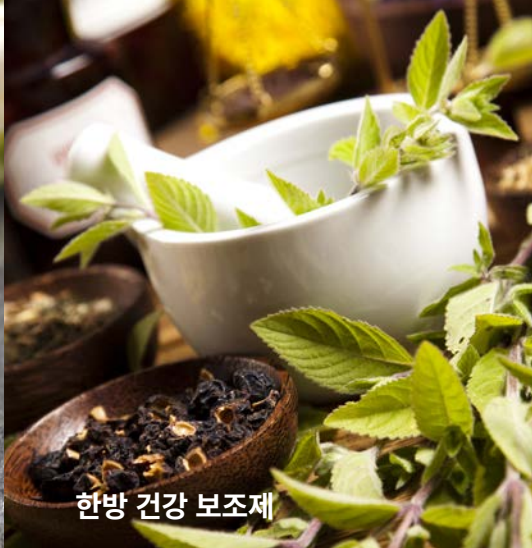
한방 건강 보조제

태극권은 고령자의 근육 에너지와 두뇌 대사를 향상시킵니다. 전반적으로 태극권은 퇴행성 관절염, 통증, 우울증, 균형 자신감, 일반적인 낙상으로 고생하는 분들에게 도움이 되며 고혈압 관리에도 효과적입니다.